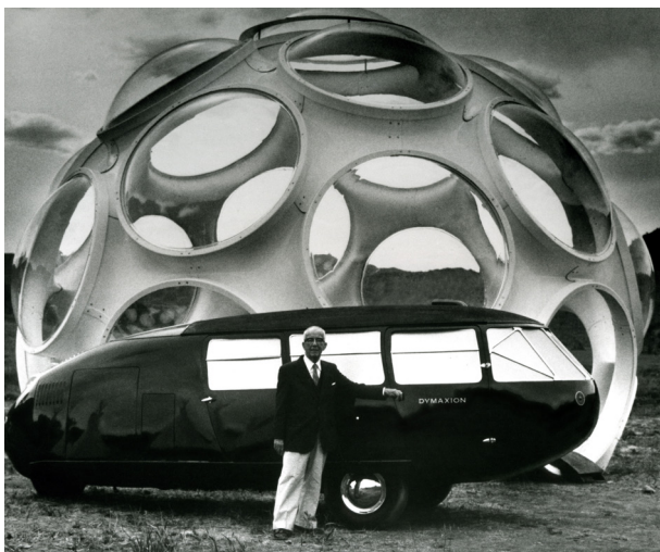
Buckminster Fuller ante el Dymaxion Car y el Fly's Eye Dome durante su 85 aniversario en Aspen, 1980.

“Curiosidad Radical. En la Órbita de Buckminster Fuller” es un viaje por el universo de un investigador y visionario inclasificable que, a lo largo del siglo XX, anticipó las grandes crisis del siglo XXI. Generador de un fascinante cuerpo de trabajo que atraviesa la arquitectura, la ingeniería, la metafísica, las matemáticas y la educación, Richard Buckminster Fuller (Milton, 1895 - Los Ángeles, 1983) dibujó una nueva manera de aunar diseño y ciencia con el potencial revolucionario de cambiar el mundo.