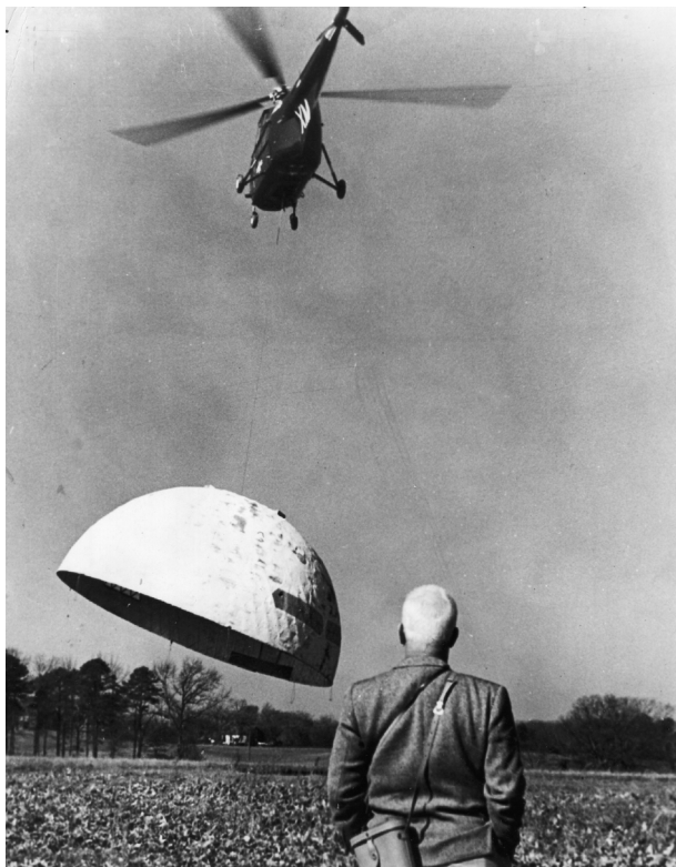
Fuller presencia cómo un helicóptero de la Marina eleva su cúpula geodésica en Orphan's Hill, 1954.