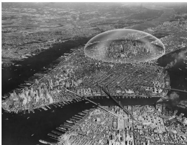
Proyecto Cúpula sobre Manhattan, 1960.

Bucky se propuso liderar lo que llamó “Design Science Revolution” [Diseño Ciencia Revolución], una revolución basada en la investigación, la experimentación y el diseño para la transformación del mundo y que se articularía en tres ejes: la vivienda (que él llamó refugio), la movilidad y la educación. Y aportaría así también conceptos nuevos, como Dymaxion (fusión de “dinámico”, “máximo” y “tensión”), Tensegrity (neologismo que funde “tensión” e “integridad”) o Ephemeralization [efemeralización], la capacidad de los avances tecnológicos para hacer “más y más con menos y menos, hasta que puedas llegar a hacer todo con nada”. El ejemplo que los reuniría todos sería su proyecto más popular: la cúpula geodésica.