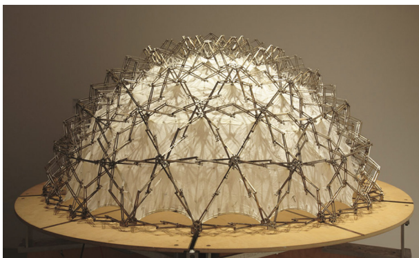
Expanding Fabric Dome, 1997. © Chuck Hoberman, Inventor and Designer.

Retomando las inquietudes y estrategias de Fuller y de algunos de sus coetáneos colaboradores, investigadores contemporáneos siguen en la actualidad los vectores de sus ideas. La muestra incluye el trabajo de artistas, arquitectos y diseñadores como Olafur Eliasson, Norman Foster, Chuck Hoberman, Andrés Jaque, Gyula Kosice, Joris Laarman, Tomáš Libertíny, Isamu Noguchi, Neri Oxman, José Miguel de Prada Poole, Cedric Price, Abeer Seikaly, Studio Folder y WASP .