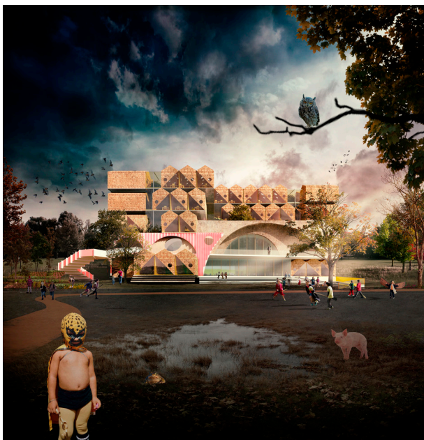
Reggio School, El Encinar de los Reyes, 2019. © Andrés Jaque / Office for Political Innovation

Estos dos últimos dispositivos se vinculan con el gran proyecto que absorbió a Bucky en los últimos veinte años de su vida, el World Game [Juego del Mundo]. Precedido por ideas que ya había expuesto en la década de 1940 con el World Resources Inventory [Inventario de los Recursos del Mundo], el World Game es un ambicioso proyecto que planteó el reto de recolectar los datos sobre todos los recursos del mundo con el objetivo de prever su evolución futura y poder abordar una gestión sostenible del planeta. Bucky implicó a expertos en economía, ciencias, diseño, arte y arquitectura y a estudiantes de todo el mundo, adelantándose más de cuatro décadas a la visualización de datos y a la investigación transdisciplinar. El juego del mundo anticipa también otras nociones fuertemente contemporáneas como los sistemas de democracia directa digital y la “gamificación”, el proceso de usar la lógica de los juegos para abordar tareas serias.